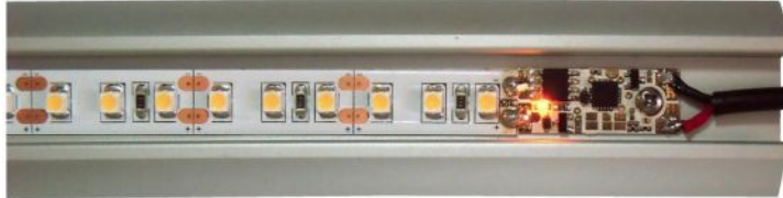
Obr. 1 - Ukázka instalace do profilu

*) Napájecí napětí nesmí být vyšší, než maximální napětí použitého LED pásu! **) V režimech 3 a 4 bez stmívání je maximální proud 10A.